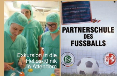
Exkursion in die Helios-Klinik in Attendorf