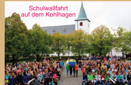
Schulwallfahrt auf dem Kohlhagen