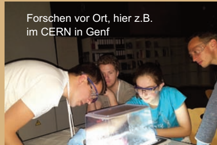
Forschen vor Ort, hier z.B. im CERN in Genf