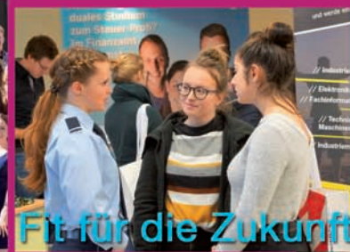
Fit für die Zukunft