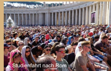
Studienfahrt nach Rom