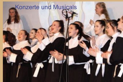
Konzerte und Musicals