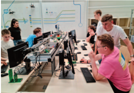
Der Technik-GK besucht die TU München

D ie Angebote in den MINT-Fächern (Mathematik, Informatik, Naturwissenschaften und Technik) ziehen sich in ganz besonderer Weise durch die gesamte Schulzeit an MK, weshalb wir u.a. 2025 als Mitglied in das bundesweite MINT-EC Netzwerk aufgenommen wurden. Schon ab Klasse 5 können technik-interessierte Schülerinnen und Schüler an der jahrgangsübergreifenden