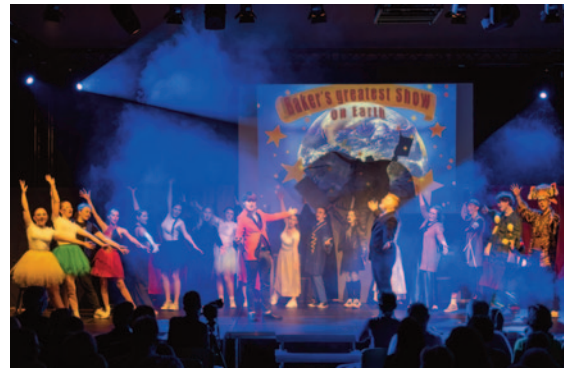
Oberstufenmusical 2024 und Unterstufenmusical 2025