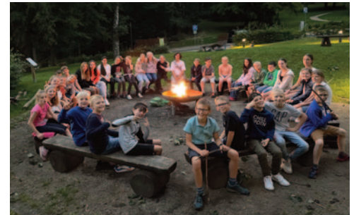
Kennenlertage der neuen 5er an der Schule

Wenn ihr euch einen Eindruck verschaffen wollt, wie die Natur rund um unsere Schule im späten Frühling aussieht, dann scannt einfach den QR-Code. Er führt euch zu einer Virtual-Reality-Tour u.a. zum Baumlehrpfad, dem Wanderweg rund um unsere Schule, dem Waldforum oder auch zu dem Klassenzimmer auf der Streuobstwiese.