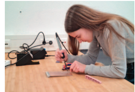
In der JIA besuchen die Schüler regelmäßig Firmen - hier die LEWA in Attendorn

Um einen vollständigen Eindruck unseres sehr umfangreichen MINT-Angebots zu bekommen, reicht es dem QR-Code zu folgen.