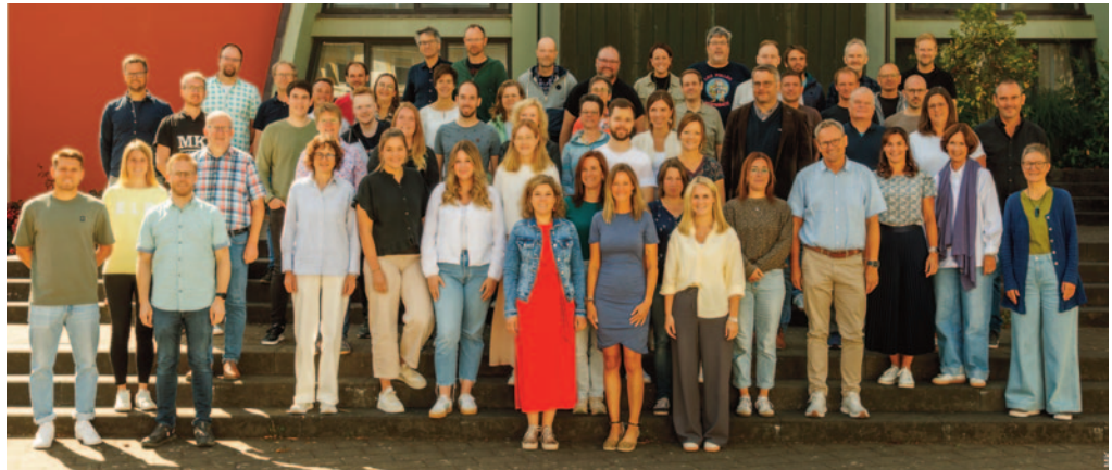
Unser Kollegium im Schuljahr 2025/26

Unsere Bildungsgänge und -abschlüsse sind gleichwertig und gleichberechtigt mit denen der staatlichen Gymnasien. Auch die gesetzlichen Regelungen hinsichtlich der Lernmittel und Fahrtkosten entsprechen denen staatlicher Schulen. Schulgeld wird an Maria Königin natürlich nicht erhoben. Aktuell unterrichten bei uns knapp 60 Lehrerinnen und Lehrer etwa 700 Schülerinnen und Schüler. Anhand unseres Logos möchten wir auf den folgenden Seiten nun ganz viel von dem vorstellen, was unser Gymnasium Maria Königin so besonders und einziartig in unserer Region macht.