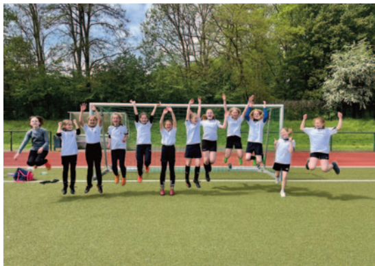
Unsere Kreis- und Bezirksmeisterinnen

W ir möchten, dass sich alle Schülerinnen und Schüler unserer Schule wohlfühlen, indem wir nicht nur eine familiäre Atmosphäre schaffen, sondern auch auf die individuellen Interessen und Talente eingehen und diese bestmöglich fördern.